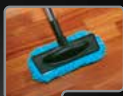
Dysza do parkietu